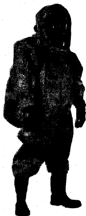
Vautex Elite S