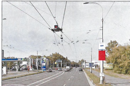
7 HRADECKÁ Flex 75x100 cm šipka rovně 1,2 km