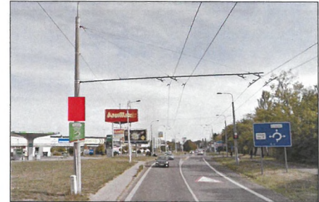
4 PODĚBRADSKÁ Flex 75x100 cm šipka vlevo 400 m