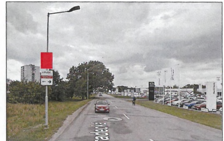
■ 16 PŘÍJEZD OD ST. HRADIŠTĚ Flex 75x100 cm šipka rovně vpravo 1,2 km