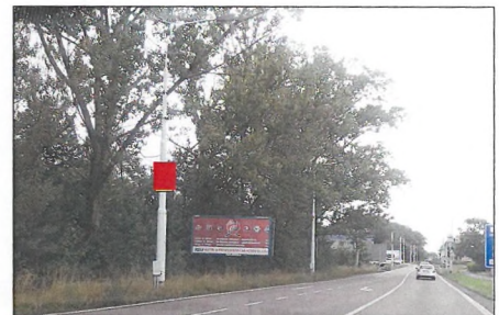
■ 19 PODĚBRADSKÁ Flex 75x100 cm šipka rovně 1,2 km