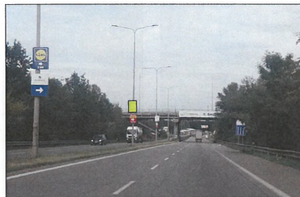
■ 23 NÁDRAŽNÍ Flex 75x100 cm šipka rovně 3,2 km