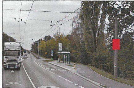
■ 13 PŘÍJEZD OD LÁZNÍ BOHDANEČ Flex 75x100 cm šipka rovně 1,8 km