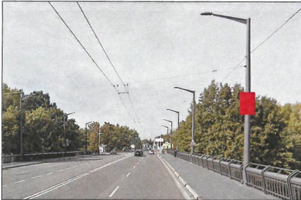
6 WONKŮV MOST Flex 75x100 cm šipka rovně 1,8 km