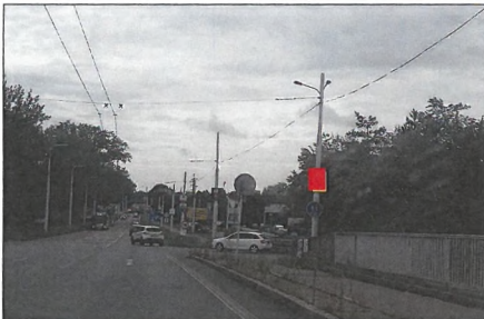
■ 17 PODĚBRADSKÁ Flex 75x100 cm šipka rovně 1,3 km