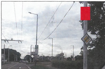
■ 20 PODĚBRADSKÁ Flex 75x100 cm šipka rovně 1,1 km