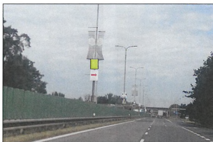
■ 24 NÁDRAŽNÍ Flex 75x100 cm šipka vpravo 1,3 km