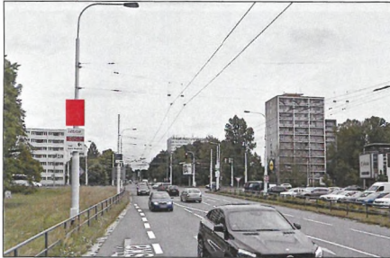
1 BĚLEHRADSKÁ Flex 75x100 cm šipka vlevo 1,1 km