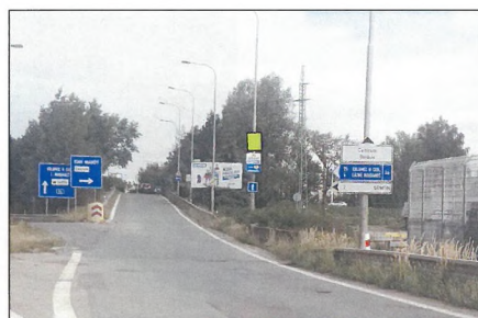
■ 25 NÁDRAŽNÍ SJEZD KE KFC Flex 75x100 cm šipka vpravo 1,2 km