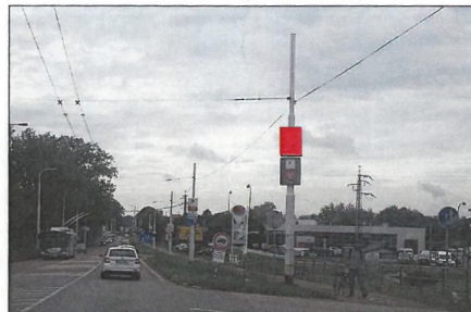
■ 18 PODĚBRADSKÁ Flex 75x100 cm šipka rovně 1,3 km