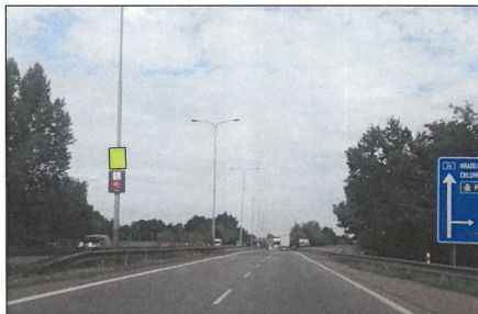
■ 22 NÁDRAŽNÍ Flex 75x100 cm šipka rovně 3,4 km