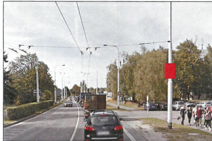
2 PODĚBRADSKÁ Flex 75x100 cm šipka rovně 550 m