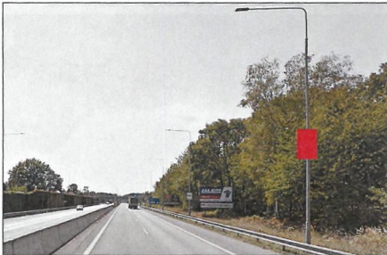
■ 9 PŘÍJEZD OD HRADCE Flex 75x100 cm šipka vpravo 1,8 km