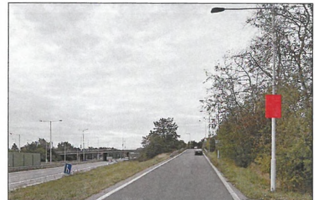
8 PŘÍJEZD OD HRADCE Flex 75x100 cm šipka vlevo 1,6 km