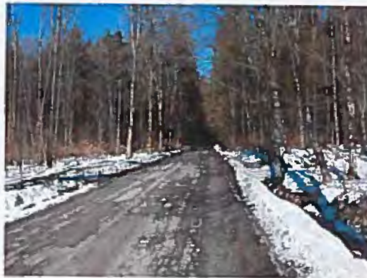
Silnice III/26211 Kamenický Šenov - Slunečná, rekonstrukce silnice