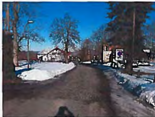
Silnice III/26211 Kamenický Šenov - Slunečná, rekonstrukce silnice