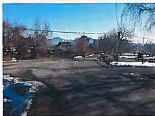
Silnice III/26211 Kamenický Šenov - Slunečná, rekonstrukce silnice