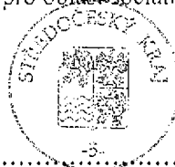
razítka Středočeského kraje