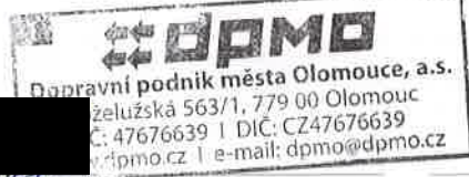
přesný název firmy nebo otisk razítka