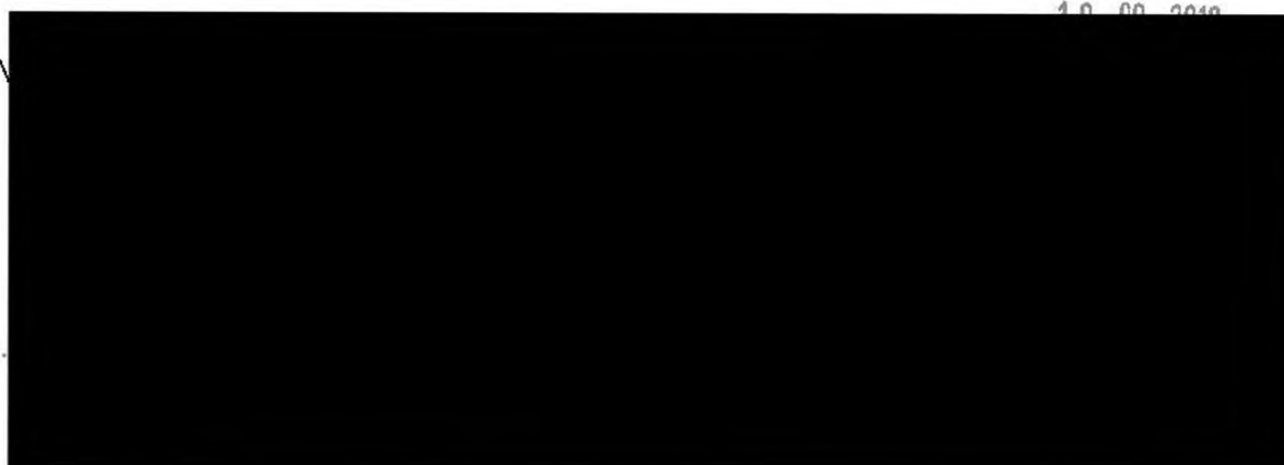
Příloha č. 1: Orientační zjištění stavu městských organizací – stacionární telefonie