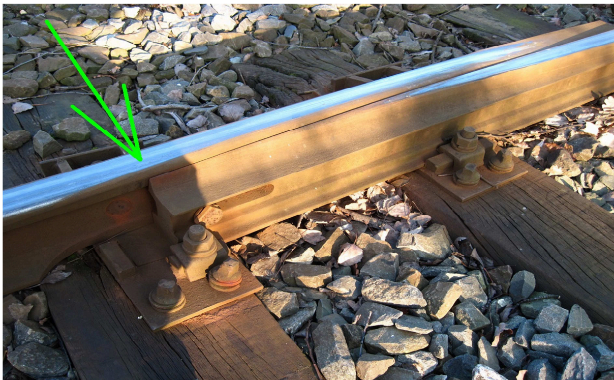
začátek jazkové kolejnice (hrot DZ)