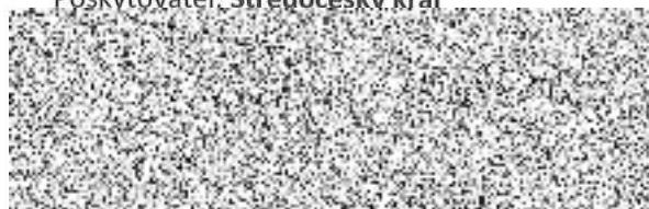
Martin Draxler radní pro oblast regionálního rozvoje cestovního ruchu a sportu