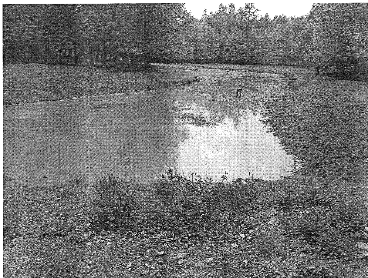
Pohled z přístupové cesty