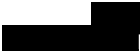
Střední odborná škola lesnická a strojírenská ředitel