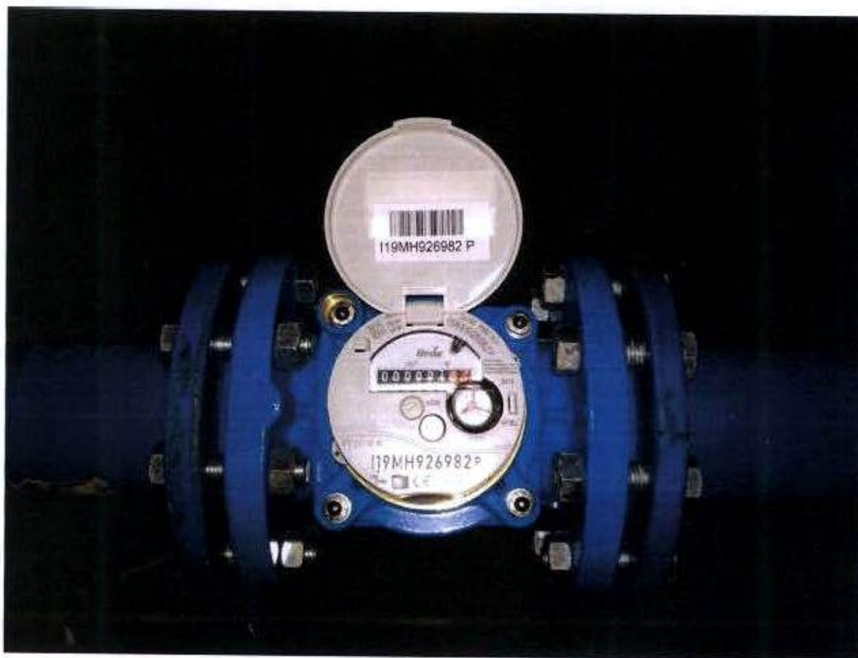
Příloha č. 2: Fotografie instalovaného měřidla se značkou ověření měřidla