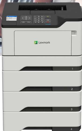
B2546dw s volitelnými zásobníky