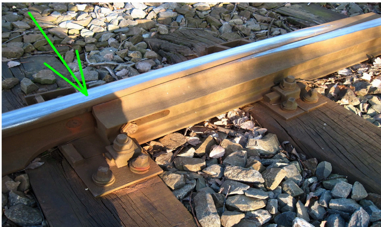
začátek jazýkové kolejnice (hrot DZ)