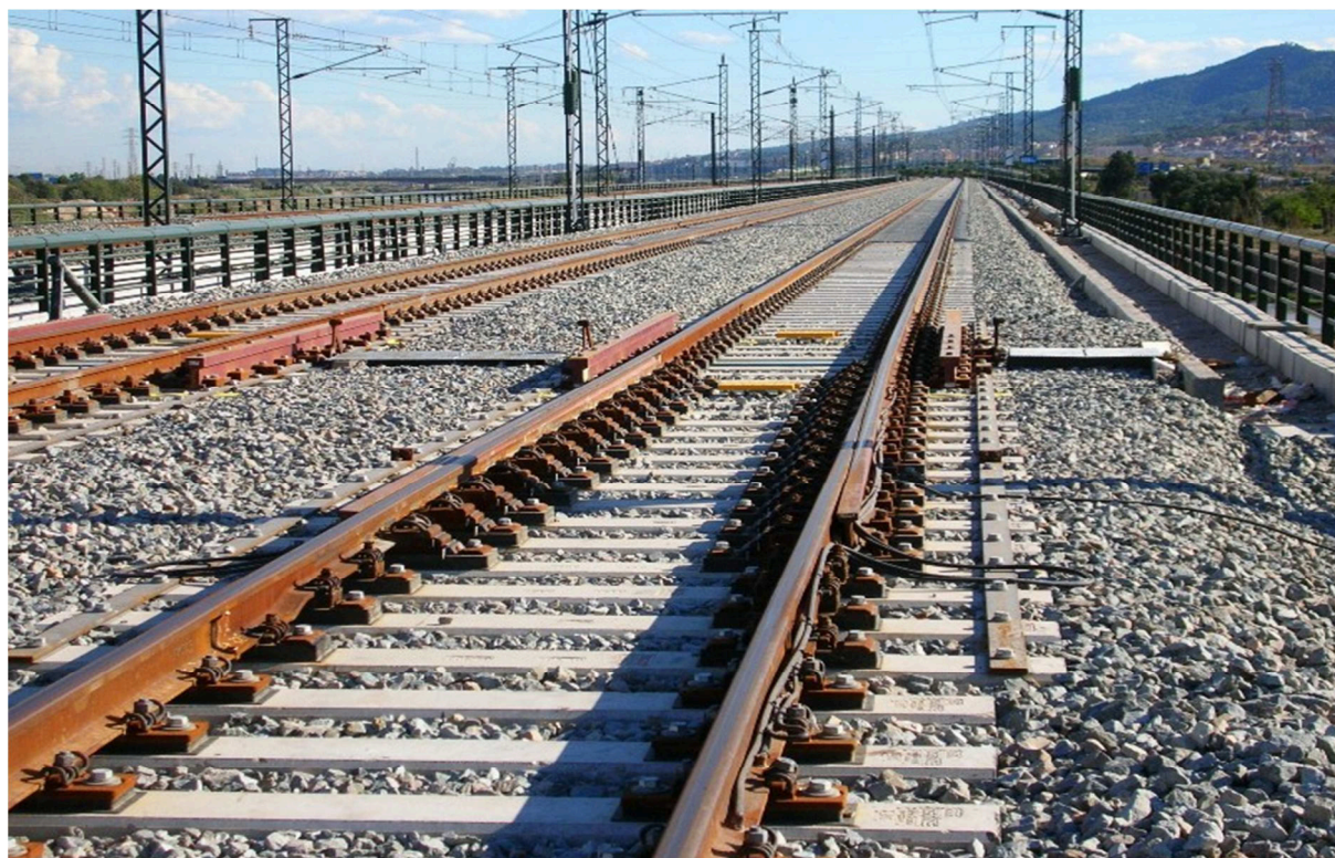
příklad správné fotodokumentace DZ – fotografie musí být vždy pořízena ve směru staničení