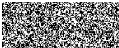
Mgr. Jiří Severa prezident Tenisového klubu Olymp Praha o.s. (za vypůjčitele)

TK Olymp Praha o.s. Za Císařským mlýnem 1063/5 170 00 Praha 7 IČO: 22606092 ①