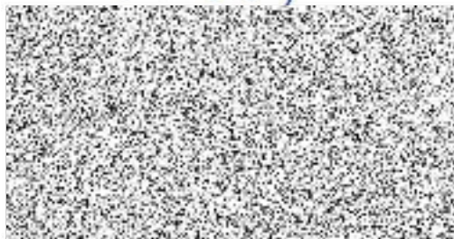
ředitel Fakultní nemocnice v Motole