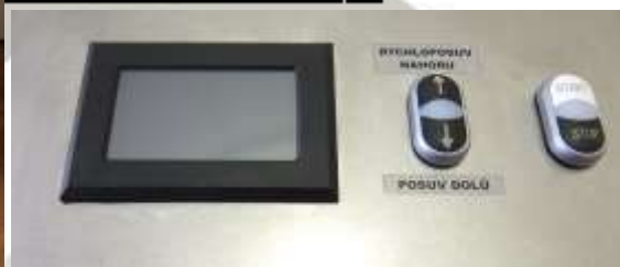
řídící panel BSML 21