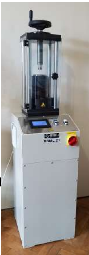
obdobný lis bez gumových nožek