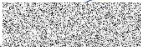
Ing. arch. Jan Dvořák Ateliér Dvořák architekti