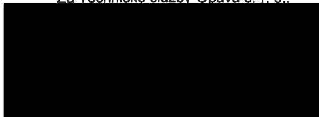
Ing. ... jednatel společnosti