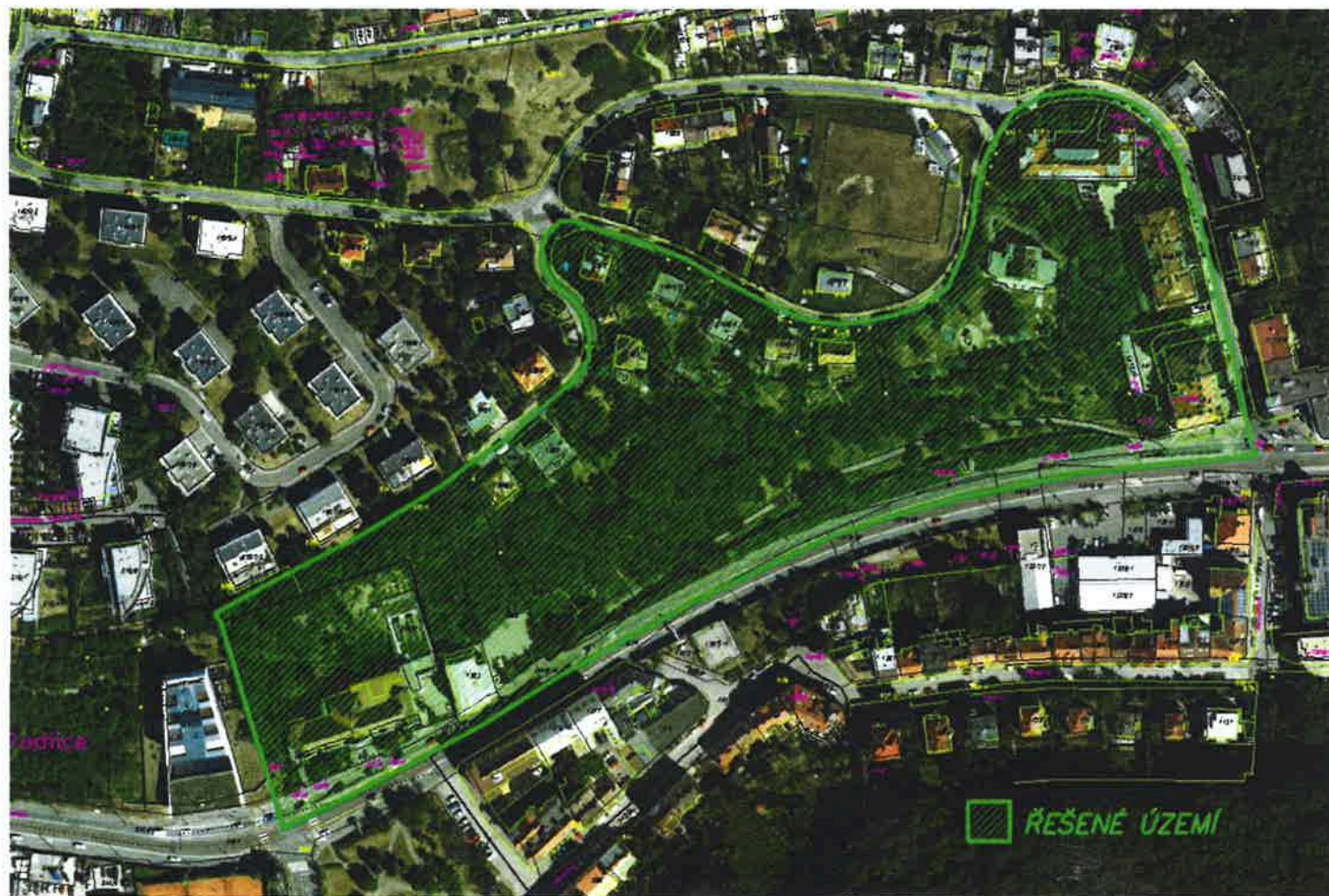
zákres řešeného území do ortofotomapy