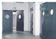
PROTIPOŽÁRNÍ DVEŘE PROTIHLUKOVÉ DVEŘE MULTIFUNKČNÍ DVEŘE