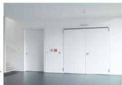
BEZPEČNOSTNÍ DVEŘE VÍCEÚČELOVÉ DVEŘE VENKOVNÍ DVEŘE VNITŘNÍ DVEŘE