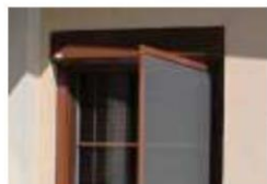
SÍTĚ PROTI HMYZU