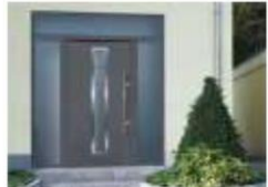
VCHODOVÉ DVEŘE, VNITŘNÍ DVEŘE, MULTIFUNKČNÍ DVEŘE