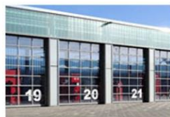
SEKČNÍ VRATA ROLOVACÍ VRATA RYCHLOBĚŽNÁ VRATA PROTIPOŽÁRNÍ VRATA