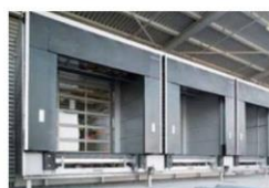
NAKLÁDACÍ MŮSTKY PŘEDSAZENÉ KOMORY TĚSNÍCÍ LÍMCE