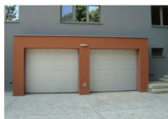
SEKČNÍ VRATA ROLOVACÍ VRATA VÝKLOPNÁ VRATA BOČNÍ POSUVNÁ VRATA