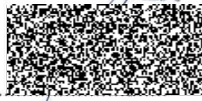
Miroslav Bláha vedoucí prodeje Česká republika

POLICIE ČESKÉ REPUBLIKY KRAJSKÉ ŘEDITELSTVÍ POLICIE ÚSTECKÉHO KRAJE POŠTOVNÍ SCHRÁNKA 179 401 79 ÚSTÍ NAD LABEM