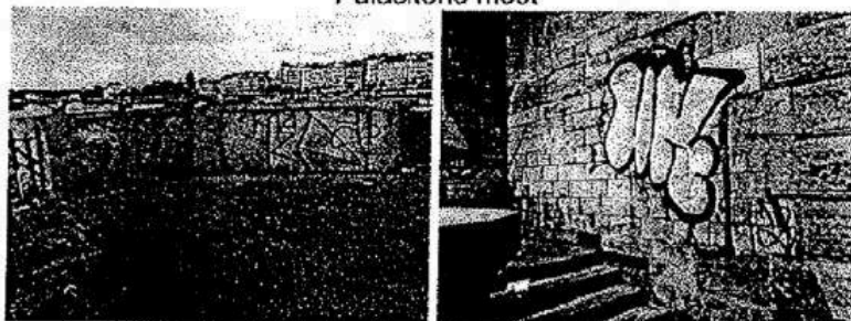
Lávka na Železničním mostě