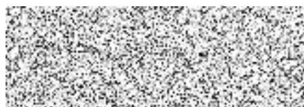
Mgr. Petr Lastovicka náměstek primátorky statutární město Jihlava