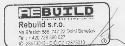
za zhotovitele Lukáš Kozma