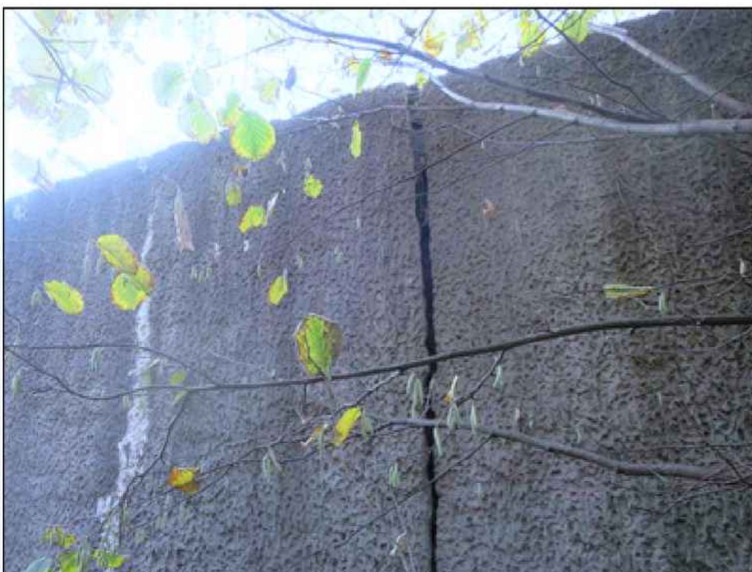
DTTO - separace pokračuje i na líc parapetní zdi