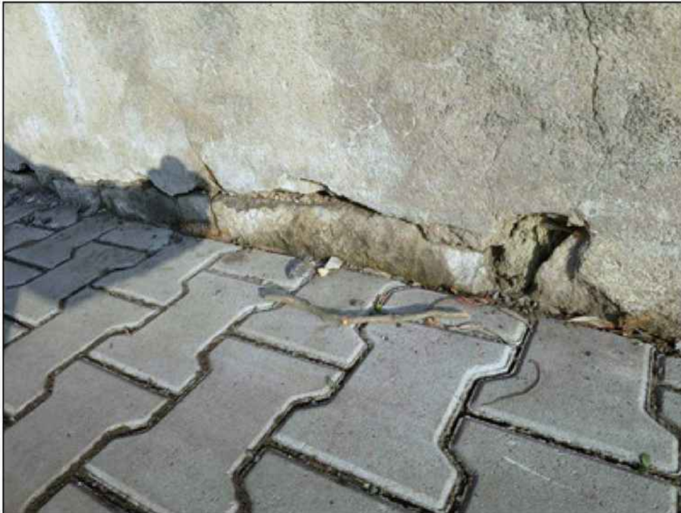
v oblastech obnaženého zdiva parapetní zidky jsou patrné poruchy spárování zdiva