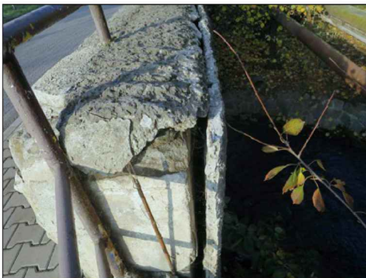
separace torkretu z líce levé parapetní zídky