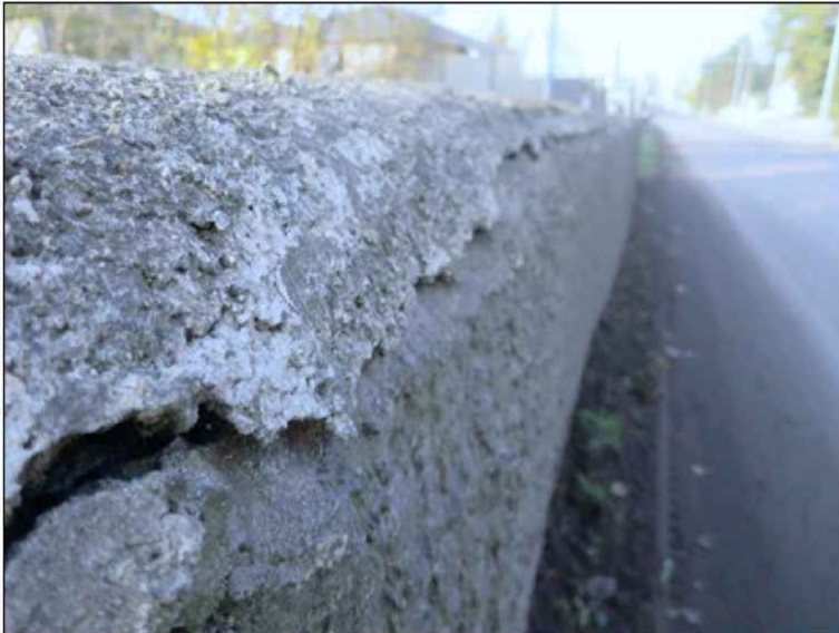
DTTO - detail