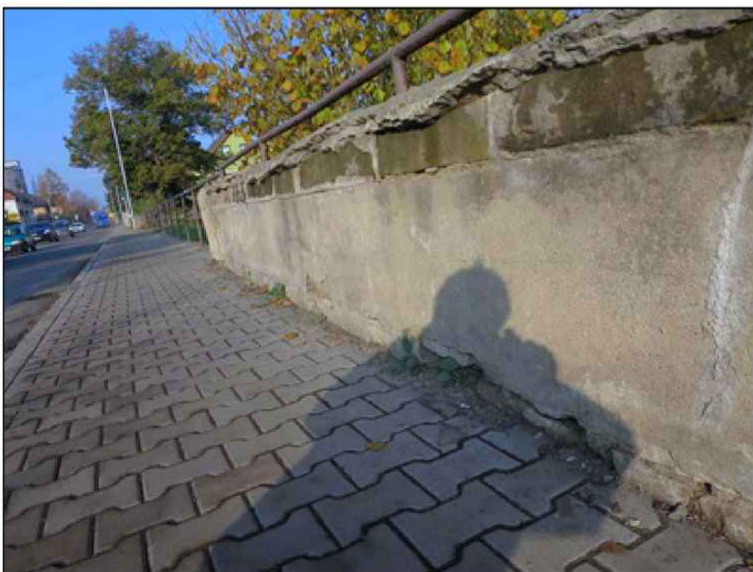
pohled na levou parapetní zidku