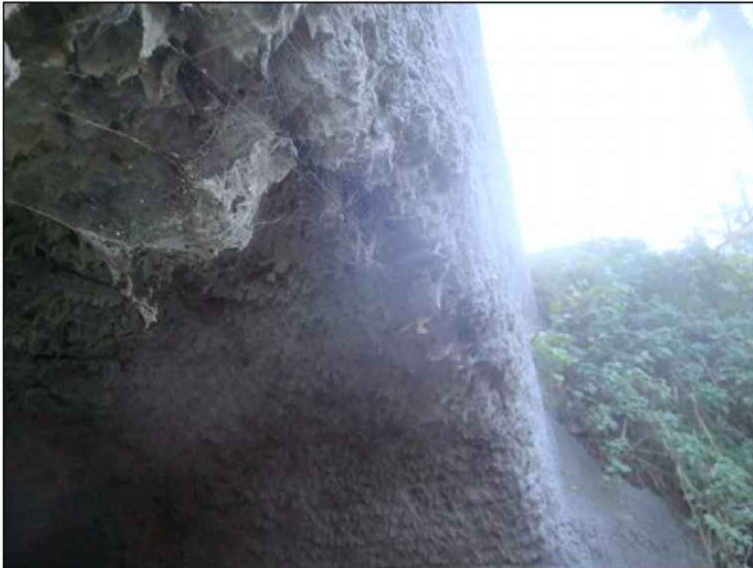
trhlina v torkretu na hraně klenbového pasu