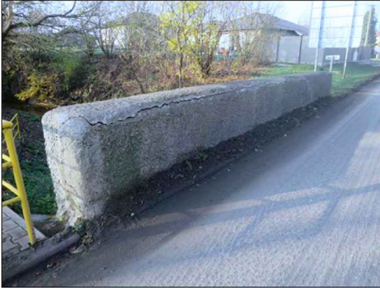
DTTO z líce pravé parapetní zídky