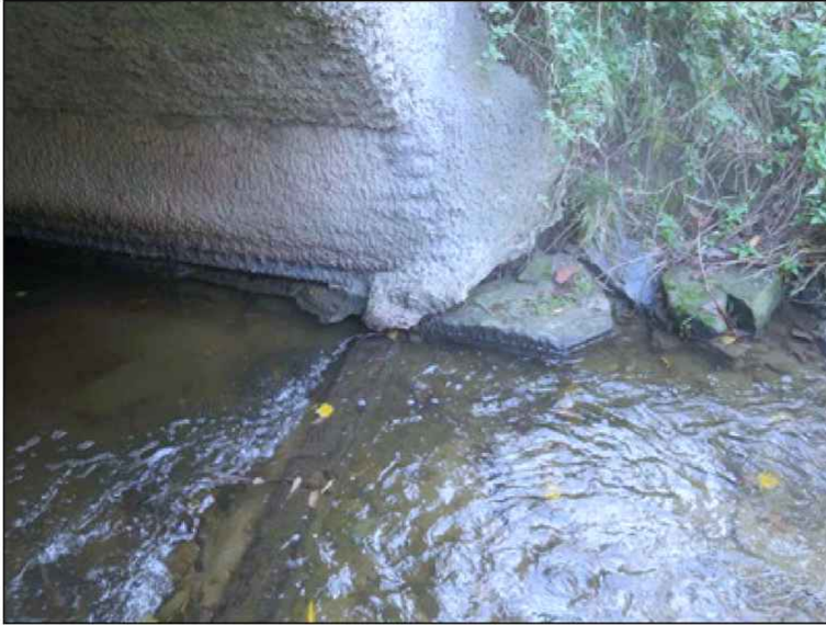
částečně podemletý dřík opěry v úrovni kolísání běžné hladiny poroka