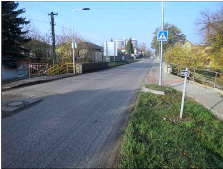
příčné uspořádání na mostě proti směru staničení