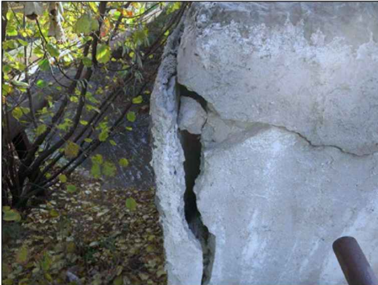
separace torkretu z líce zdiva zábradelní zidky