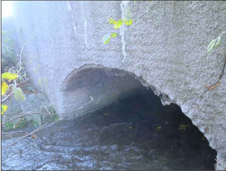
pohled na levý bok - v hraně klenbového pasu opět pokračuje separace torkretu od zdiva