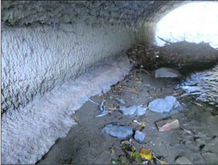
pohled na líc opěry