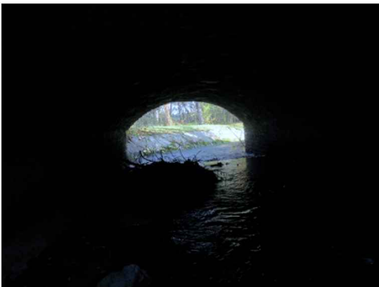
naplaveniny v mostním ovtoru