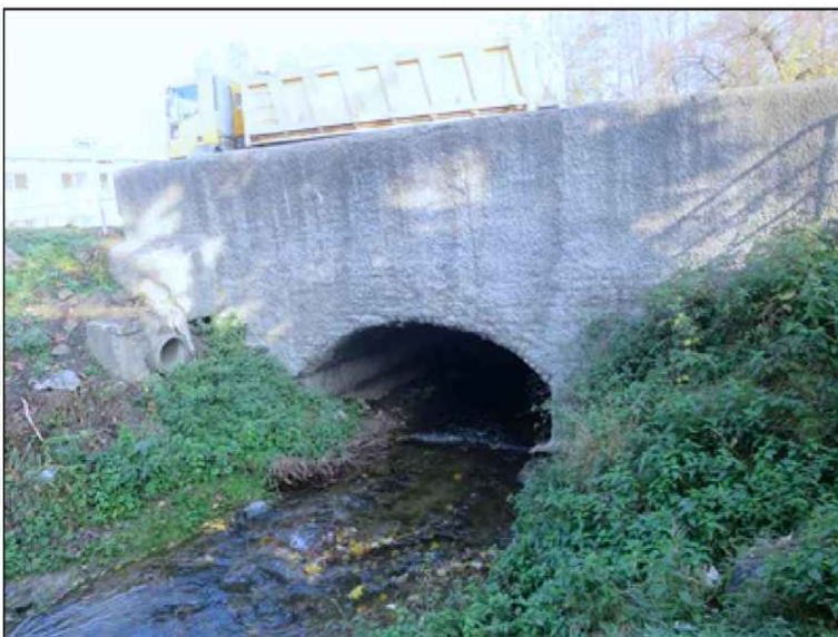
pohled na pravou stranu mostu