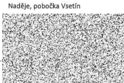
Naděje, pobočka Vsetín