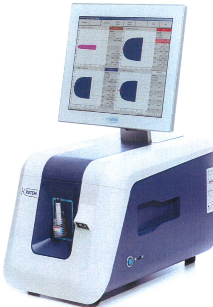
Obr. Tromboelastometr ROTEM® sigma