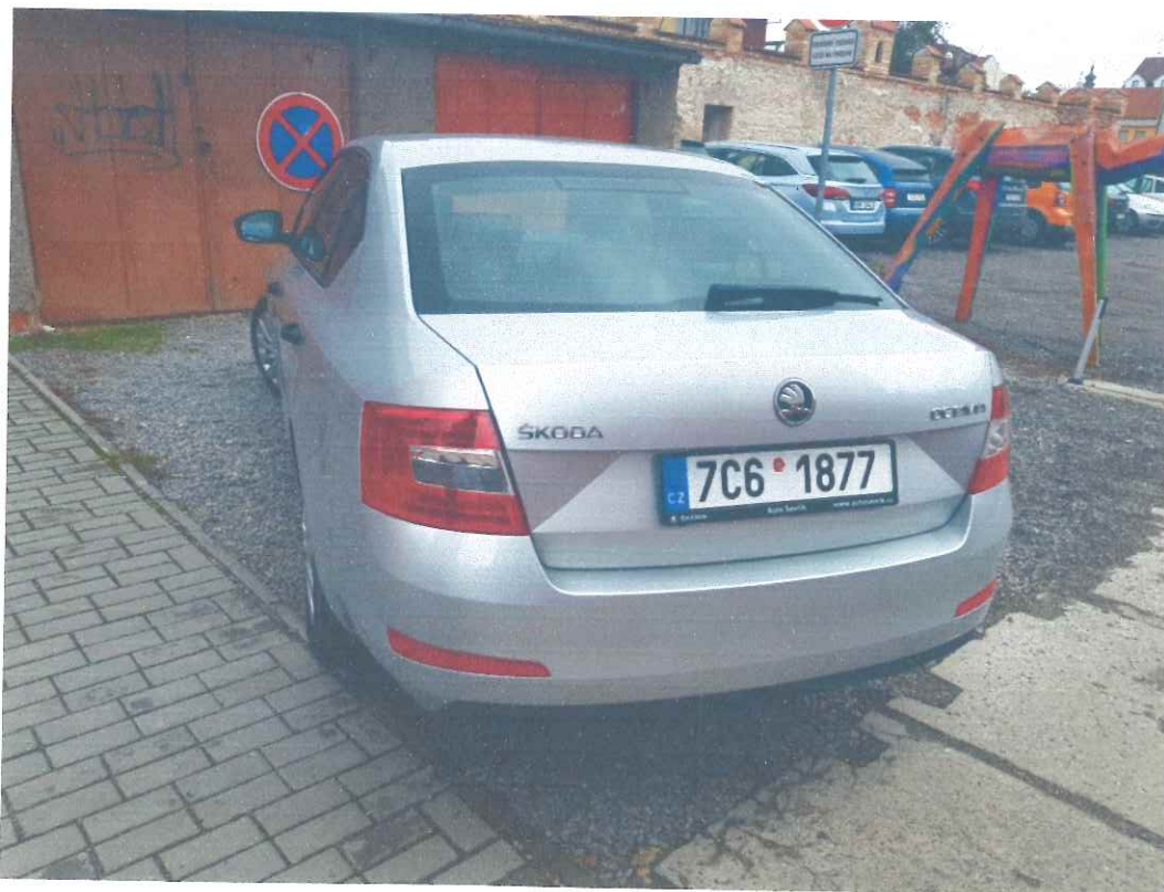
Obr. 1 a 2 – celkové pohledy na ŠKODA Octavia