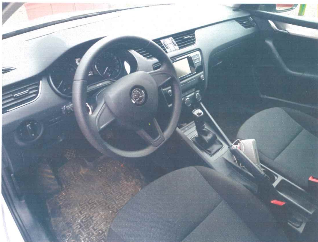
Obr. 3 – celkový pohledy do interiéru ŠKODA Octavia