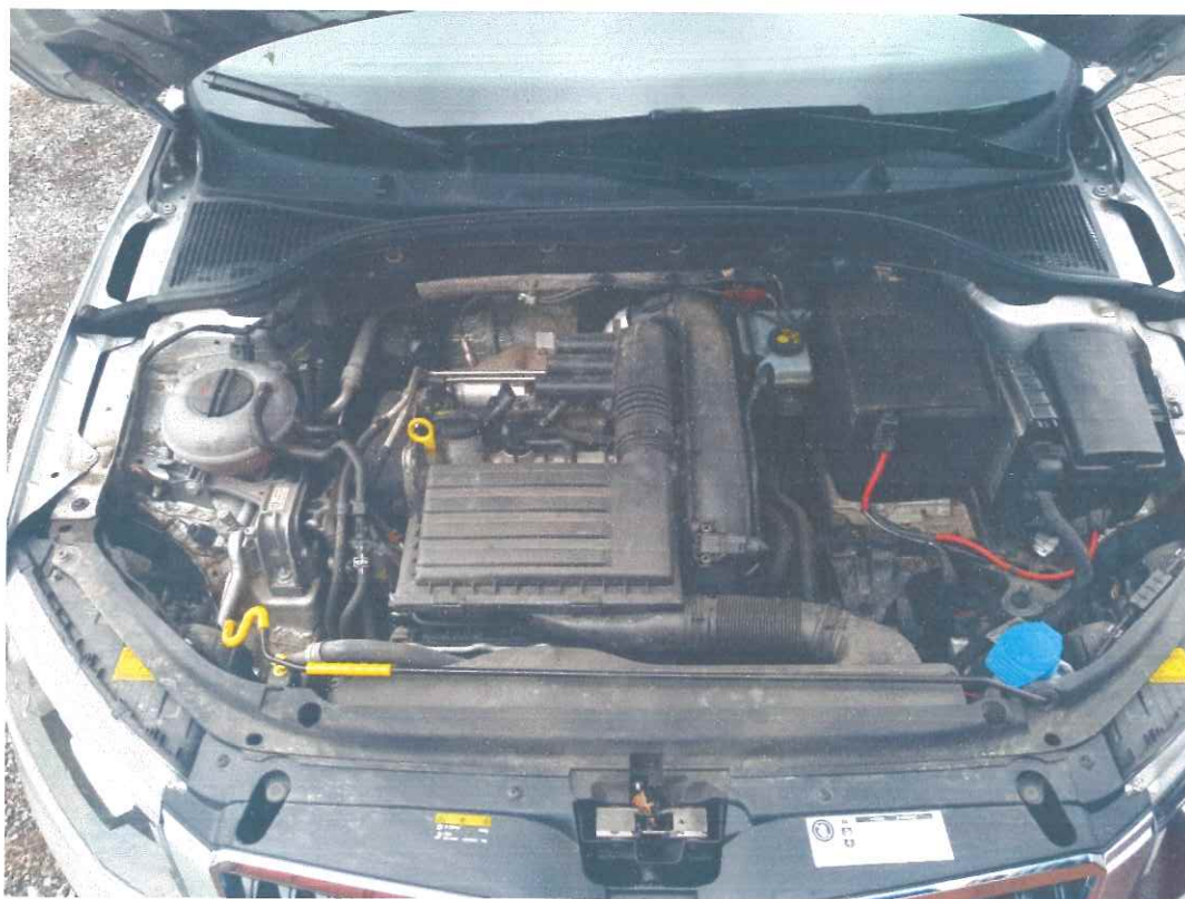
Obr. 4 – celkový pohled do motorového prostoru ŠKODA Octavia