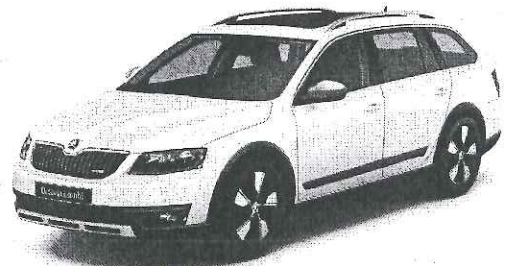
ŠKODA Octavia Scout