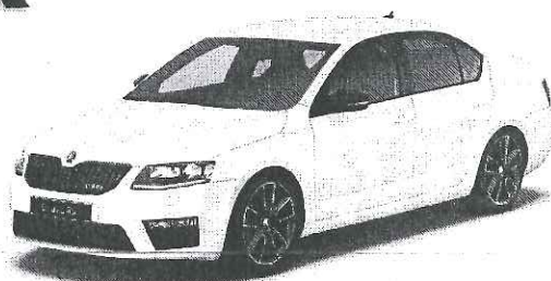
ŠKODA Octavia RS