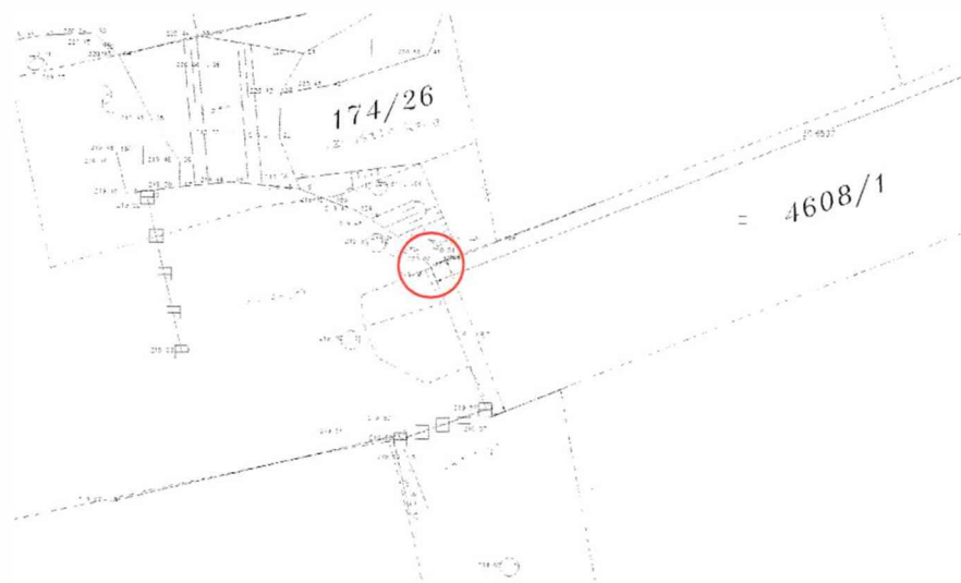
Umístění kopané sondy