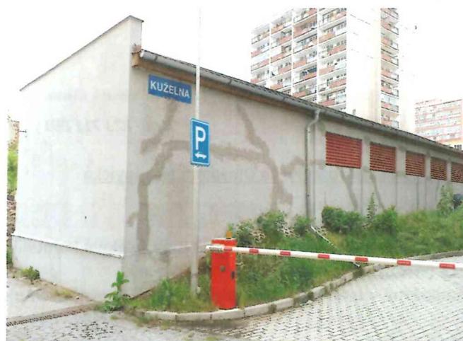
Stav objektu k 23.5.2019