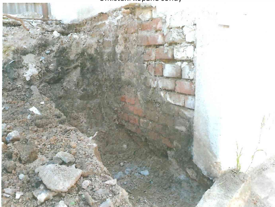
Kopaná sonda – stav 30.5.2019