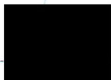
Junior upisovatel pojištění odpovědnosti