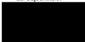
Mgr. Jiří Zemánek 1. náměstek hejtmana Olomouckého kraje