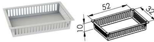
Koš M – 2 x do jedné skříně