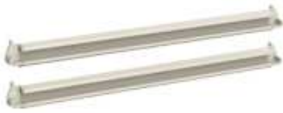
Horizontalní lišty (1 pár) – 24 ks do jedné skříně