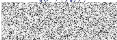
Radka Šepkova Sodexo Pass Česká republika a.s.