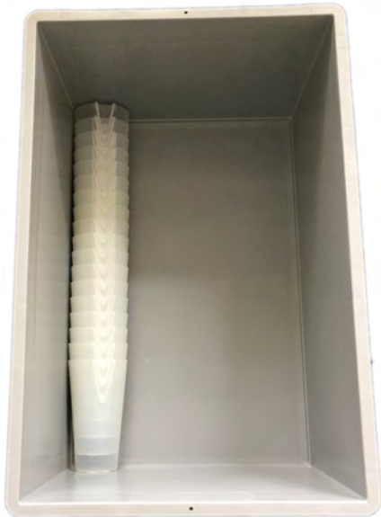
A: 0,5l – Šedý box