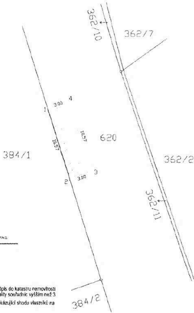
Seznam souřadnic KS-JTSK:

druh věcného břemene: právo díle listiny oprávněný: díle listiny