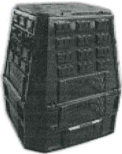
Obrázek č. 1: Příklad kompostéru