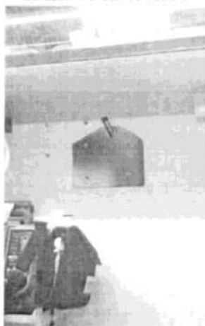
Obrázek 1 Držák ve vozidle