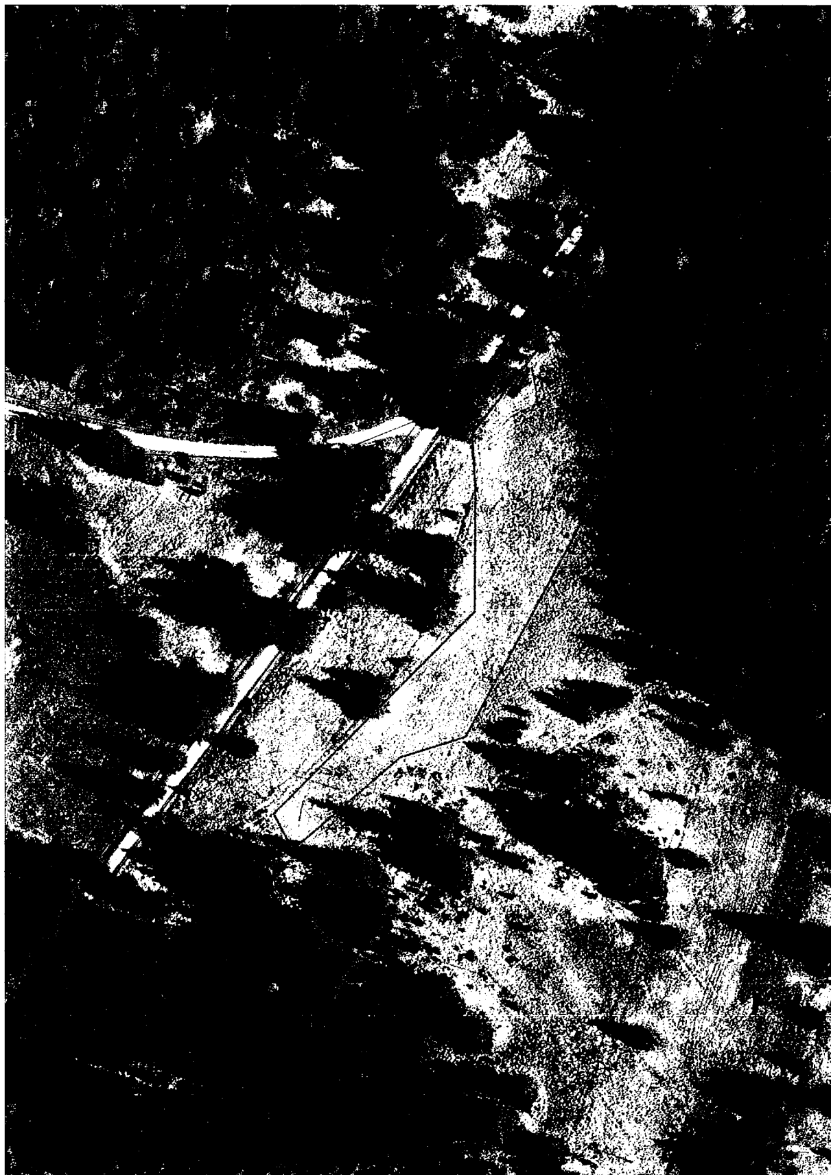
Raškov 1 k. ú. Nová Pec