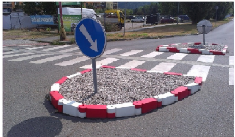
5786/170 OSTRŮVKY Z PLASTOVÝCH OBRUBNÍKŮ