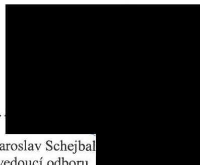
Bc. Jaroslav Schejbal vedoucí odboru