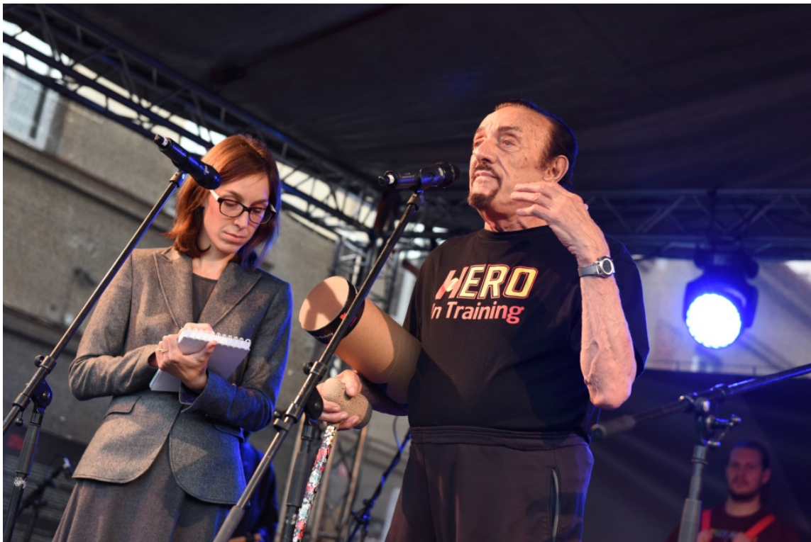
(Philip Zimbardo na Nádraží Bubny)

Máme také k dispozici desítky tisíc portrétních fotografií z archivu policejního ředitelství. Jsou na nich tváře, které nádražím Bubny v době deportací prošly a nevrátily se. K tomuto tématu patří i vagony, které budou jednou umístěny podél peronu. Jsou to vagony normální rychlíkové, žádné dobytčáky - důkaz německé schopnosti zachovat klid v prostředí města i při masové vraždě.