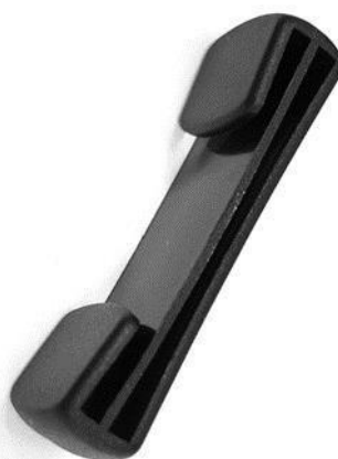
Detail plastové posuvky