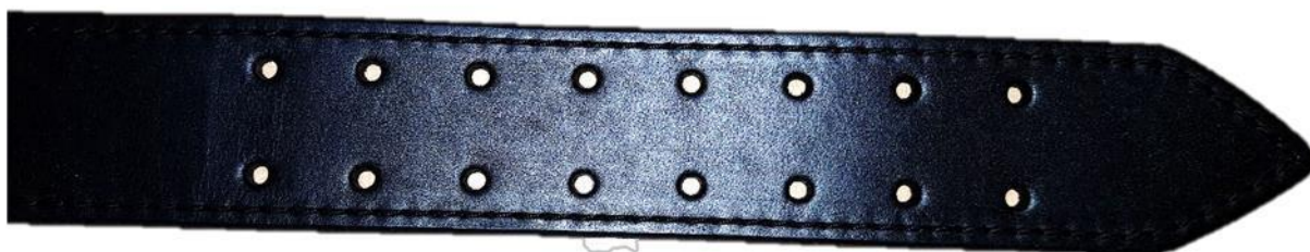
Detail ukončení pásu