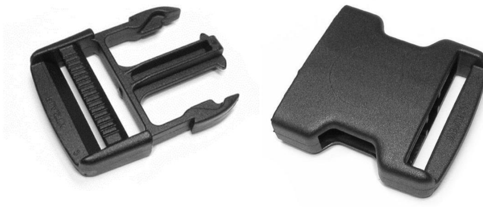
Detail plastové spony