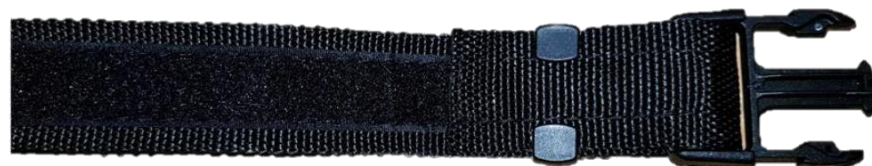
Detail ukončení opasku s VELCRO páskou