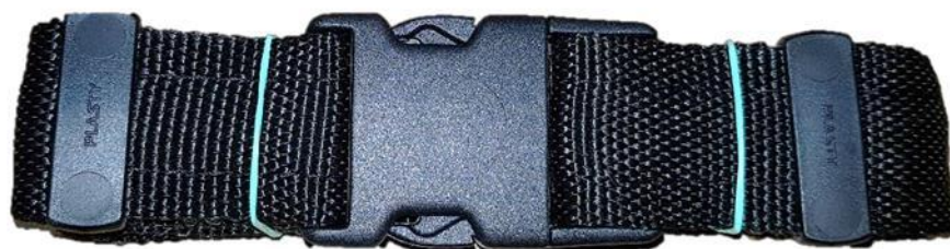
Detail sbaleného opasku