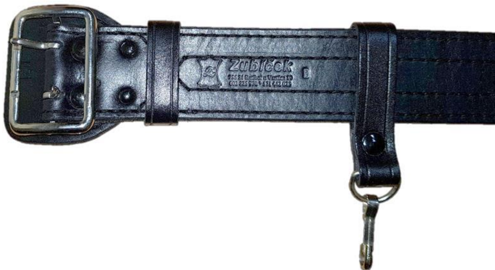
Detail spony, vsuvky, klíčanky a značení pásu