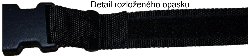
Detail rozloženého opasku