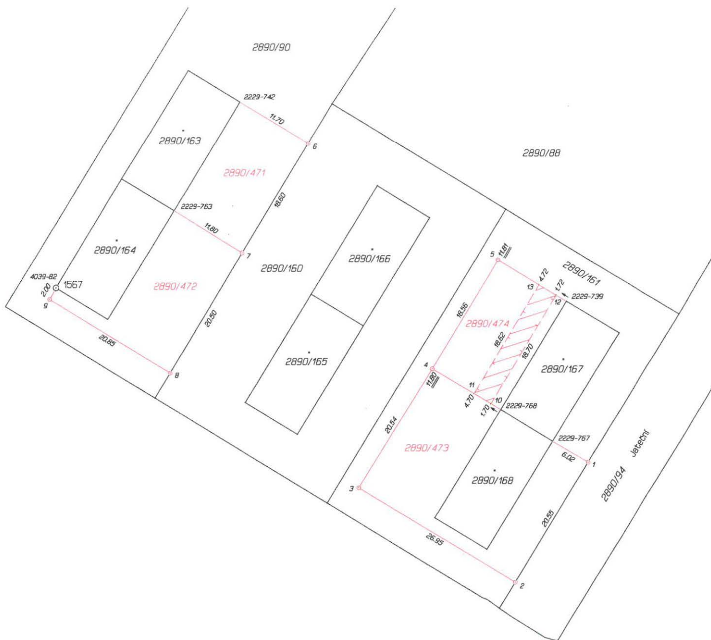
Seznam souřadnic (S-JTSK) Číslo bodu Souřadnice pro zápis do KN Y X Kód kv. Poznámka