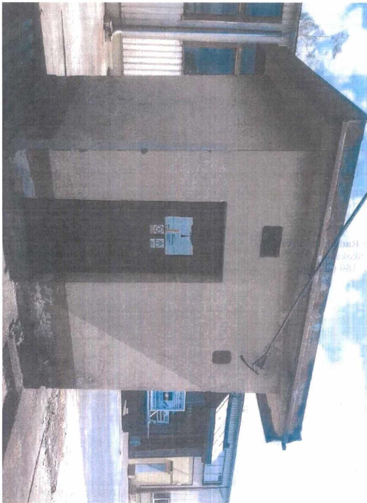
Příloha č. 1 – fotodokumentace darované nemovitosti