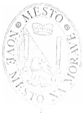
Michal Šmarda starosta

Pro: 6, Proti: 0, Nehlasoval: 0, Zdržel se: 0, Omluven: 1 Usnesení bylo: PŘIJATO