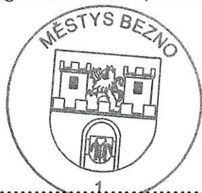
..... 1 razítko