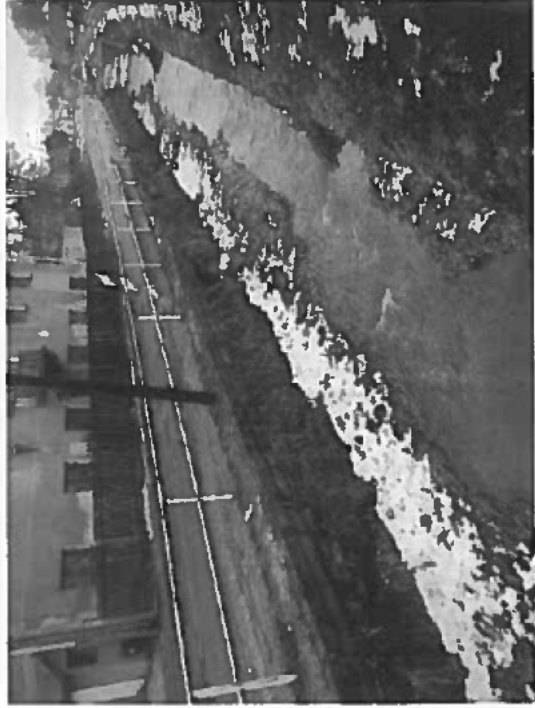
III/2627 Volfartice, rekonstrukce opěrných zdí (3x)