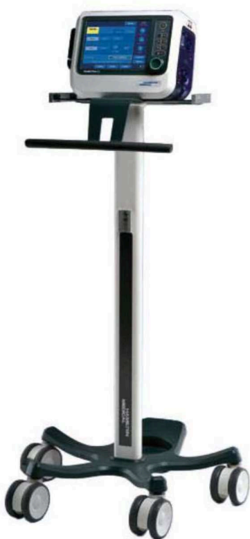
Obr: plicní ventilátor Hamilton C1

Nabízený typ: Hamilton C1, výrobce Hamilton Medical, Švýcarsko