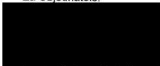
Ladislav Okleštěk hejtman Olomouckého kraje